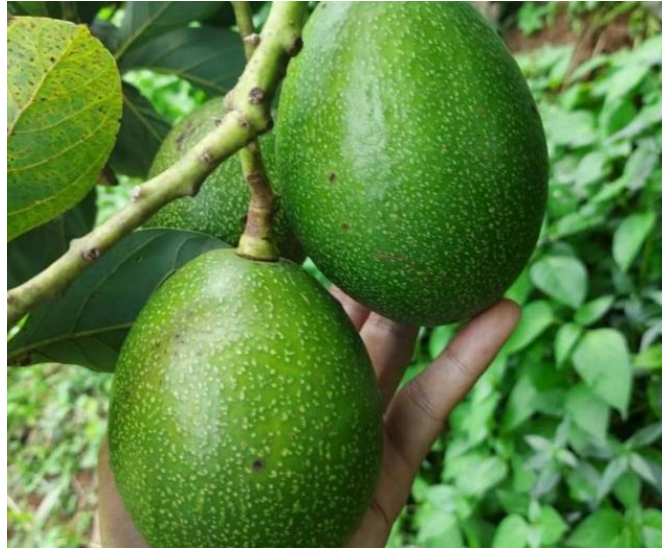
ภาพ 2 พันธุ์บัคคาเนีย