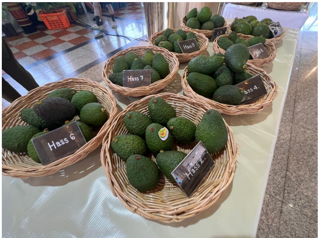
ภาพ 7 ผลผลิตอาโวคาโด