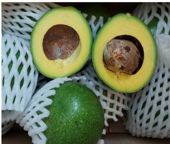
ภาพ 1 พันธุ์พิงเคอร์ตัน

อะโวคาโด (Avocado) หรือ Alligator Pear เป็นพืชในวงศ์ Lauraceae มีชื่อวิทยาศาสตร์ว่า Persea americana Mill. มีถิ่นกำเนิดในอเมริกากลาง เมื่อร้อยกว่าปีที่แล้ว มีชนนาริชาวอเมริกันได้นำมาปลูกในเมืองไทยเป็นครั้งแรกที่จังหวัดน่านซึ่งสามารถเติบโตและผลิดอกออกผลได้ดี อะโวคาโดเป็นไม้ยืนต้นไม่ผลัดใบ สูงถึง 18 เมตร เปลือกต้นสีน้ำตาลอ่อน ผิวขรุขระ ใบรูปรีถึงรูปใบหอก มีหลายแบบขึ้นอยู่กับสายพันธุ์ แผ่นใบหนาสีเขียวสด บางพันธุ์เมื่อขยี้ใบจะมีกลิ่นหอม ช่อดอกออกที่ปลายกิ่ง ดอกขนาดเล็กเป็นดอกสมบูรณ์เพศ สีเขียวอมเหลือง ผลขนาดใหญ่ รูปทรงคล้ายสาเกี๋ย รูปไข่หรือรูปกลม ผลรูปทรงกลม แต่ละผลมี 1 เมล็ดที่นำไปเพาะได้ ที่ปลูกในประเทศไทยมีหลายพันธุ์ เช่น พันธุ์พิงเคอร์ตัน (Pinkerton) ที่มีทรงผลคล้ายรูปลูกแพร์ พันธุ์ปีเตอร์สัน (Peterson) พันธุ์บัคคาเนีย เป็นอะโวคาโดที่ชอบอากาศเย็น นิยมปลูกมากทางภาคเหนือของไทย ผลเป็นทรงรูปรี พันธุ์แฮส เป็นอะโวคาโดที่ชอบอากาศเย็นอีกพันธุ์หนึ่ง จุดเด่นที่แตกต่างจากพันธุ์อื่น คือ ผิวผลที่ขรุขระ (อภิชาติ และศุภวรรณ์, 2552)