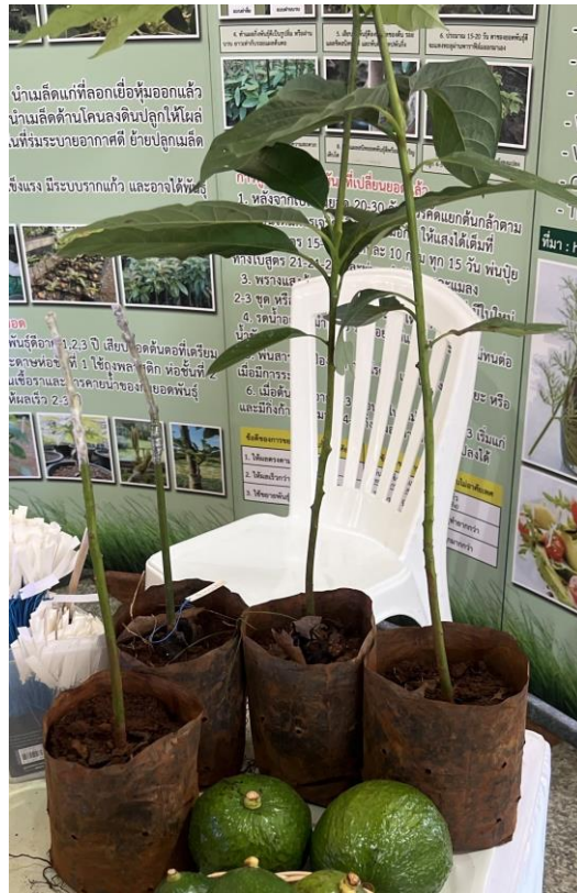
ภาพ 4 ต้นกล้าอะโวคาโด

ในฤกษ์ขนาดใหญ่ ซึ่งการปลูกด้วยต้นกล้าอายุ 1-2 ปี ต้นมีโอกาสรอดในแปลงสูงเนื่องจากมีระบบรากที่เจริญดี และรอยต่อที่เปลี่ยนพันธุ์ประสานกันดีแล้ว ทำให้ต้นแข็งแรงและพร้อมปลูกในแปลง