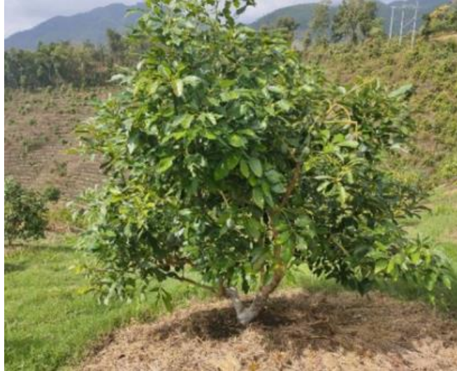
ภาพ 6 ต้นอะโวคาโด