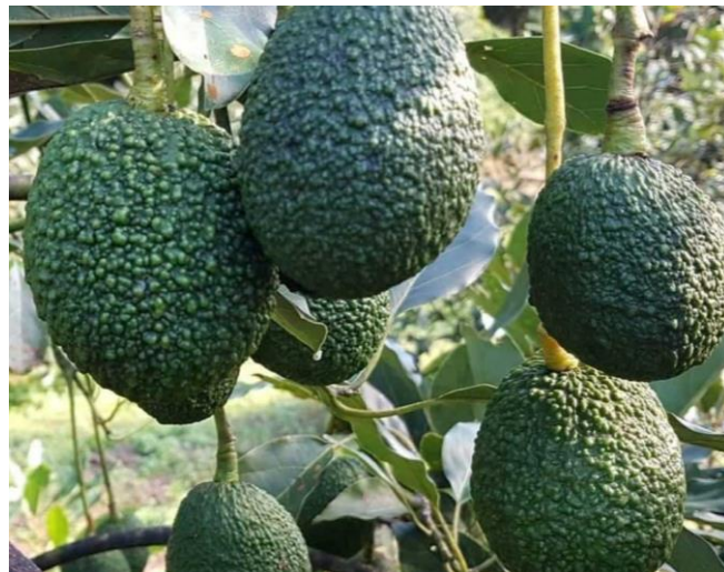
ภาพ 3 พันธุ์แฮส