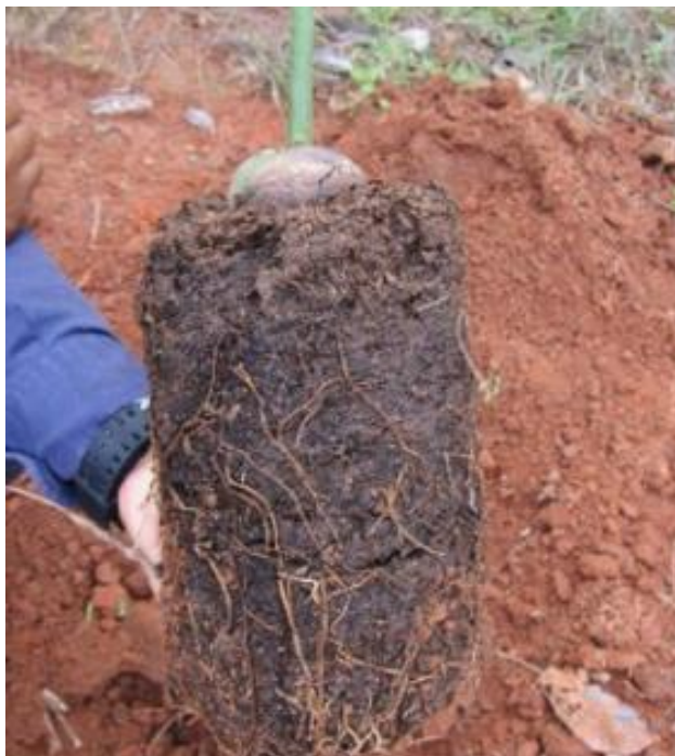
ภาพ 5 รากของต้นกล้า

ช่วงปลูก สามารถปลูกได้ตลอดปีหากสามารถให้น้ำได้ แต่หากเป็นพื้นที่สูงซึ่งไม่มีน้ำควรปลูก ช่วงต้นฤดูฝนเพราะจะมีน้ำสำหรับต้นที่ปลูกใหม่ แต่ไม่ควรปลูกกลางฤดูฝนเนื่องจากฝนตกชุก น้ำอาจท่วมขัง ต้นอะโวคาโดที่ปลูกใหม่ นอกจากนี้ ต้นหญ้า/วัชพืชในแปลงมักโตเร็วและขึ้นปกคลุมต้นอะโวคาโดทำให้ต้นโตช้าหรือตายได้ หรือปลูกช่วงปลายฝนต้นหนาวซึ่งดินยังมีความชื้นและปริมาณฝนไม่มากเหมือนเช่นฤดูฝน จะทำให้ต้นสามารถตั้งตัวได้เร็วขึ้น